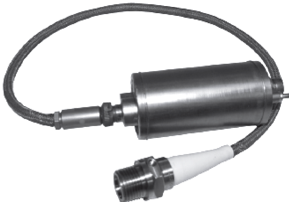
Рисунок 1 - Общий вид датчика ДХС 524

Общий вид датчика давления ДХС 524 приведен на рисунке 1, габаритные и установочные размеры – на рисунке 2.