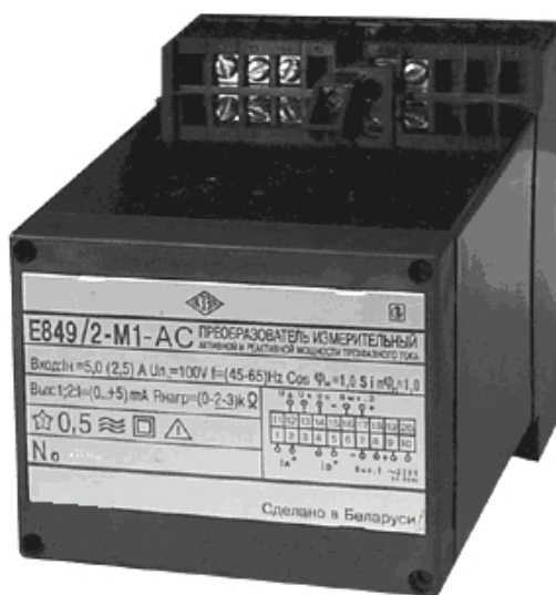
Рисунок 1 – Общий вид ИП

Схема пломбировки от несанкционированного доступа и указание мест для нанесения оттиска клейма ОТК и оттиска клейма знака поверки средств измерений на ИП приведены на рисунке 2.