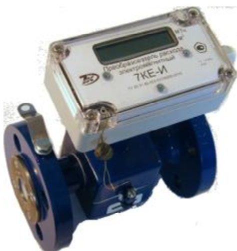
Рисунок 2 - Внешний вид преобразователей расхода 7КЕ-И

Пломбировка преобразователей расхода осуществляется нанесением давлением знака поверки и клейма ОТК изготовителя на специальную мастику, расположенную в чашечках винтов крепления печатной платы в корпусе электронного блока. Защита от несанкционированного доступа к клеммам подключения электронного блока осуществляется нанесением давлением клейма контролирующей организации на свинцовую (пластмассовую) пломбу, которая навешивается на проволоку (кордовую нить) проведенную через специальные пломбировочные отверстия в корпусе электронного блока. Места пломбирования и защиты от несанкционированного доступа преобразователей расхода приведены на рисунке 3.