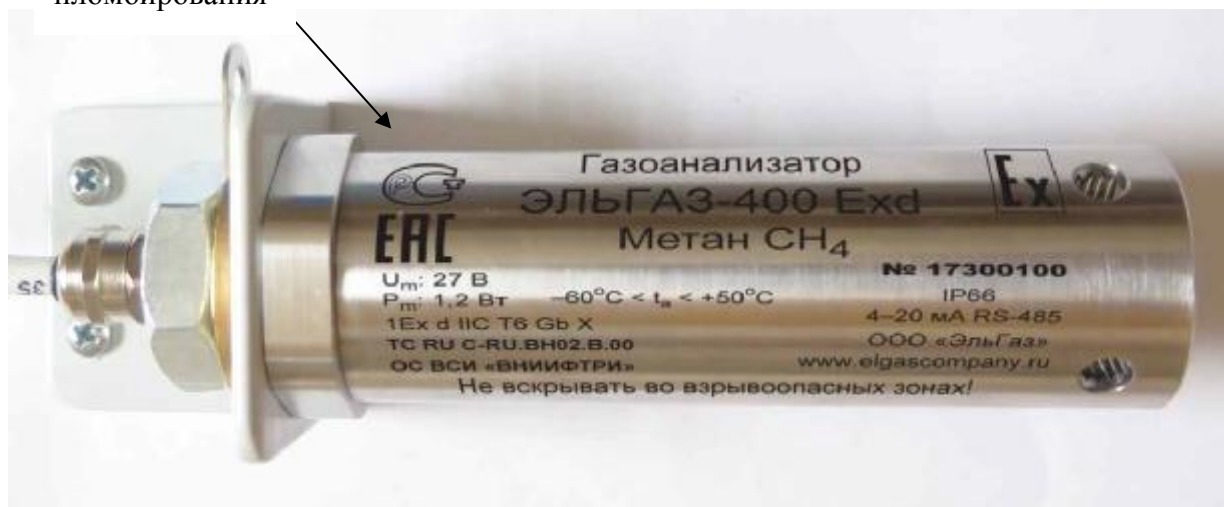
Рисунок 5 – Общий вид исполнения 400 (ЭЛЬГАЗ-400 - в металлическом взрывозащищенном корпусе Exd)