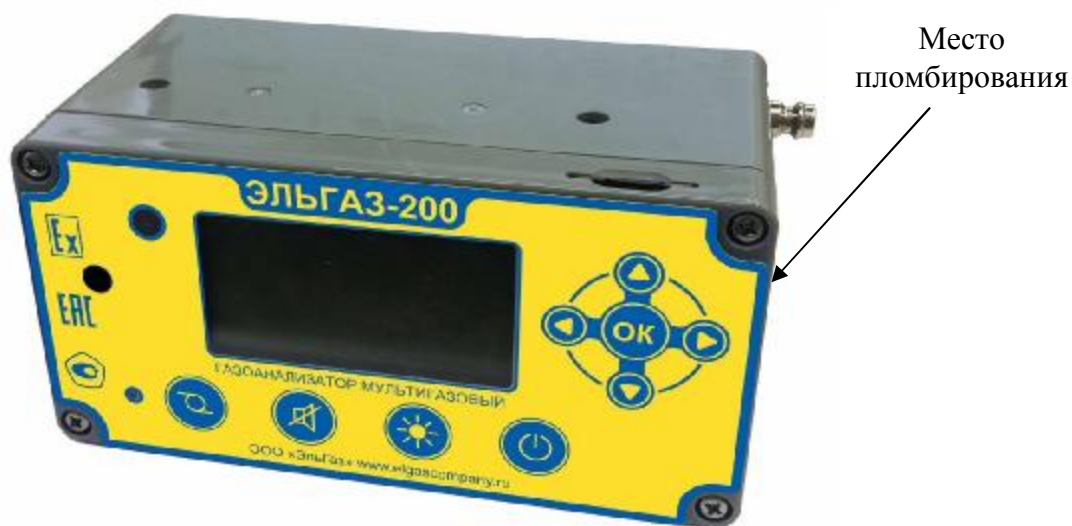
Рисунок 2 – Общий вид исполнения 200 (ЭЛЬГАЗ-200 - мультигазовый переносной)