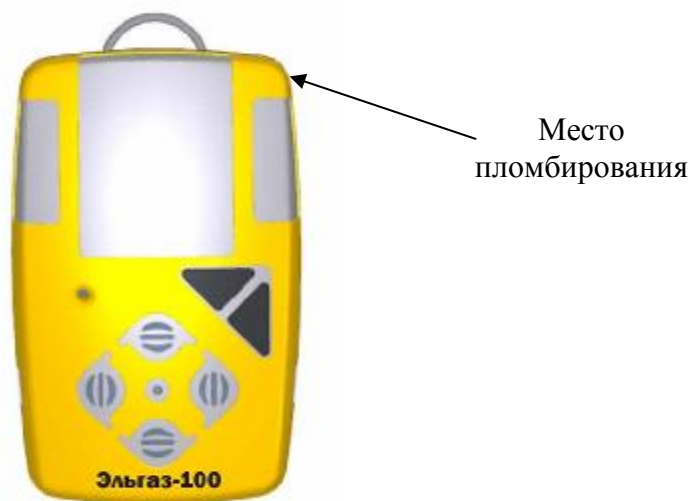
Рисунок 1 – Общий вид исполнения 100 (ЭЛЬГАЗ-100 - индивидуальный)