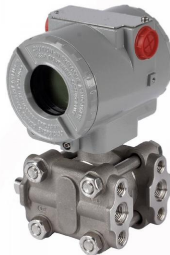
Рисунок 7 - Общий вид преобразователей давления DMD

Пломбировка преобразователей не осуществляется.