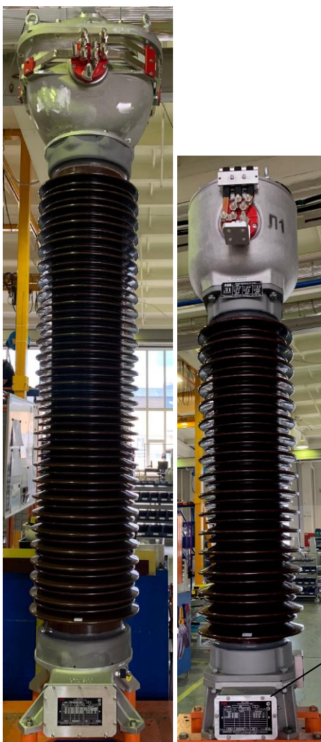
Рисунок 1 - Общий вид трансформаторов тока серии TG