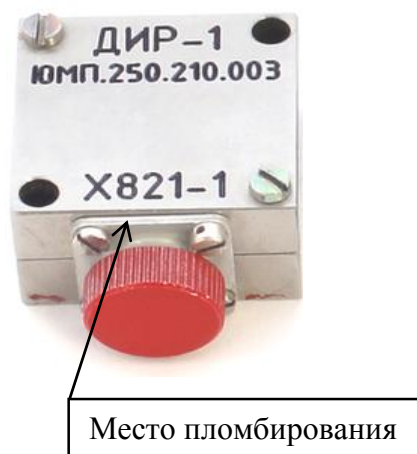
Рисунок 1 - Общий вид датчиков ДИР

Общий вид датчиков ДИР с указанием места пломбирования представлен на рисунке 1.