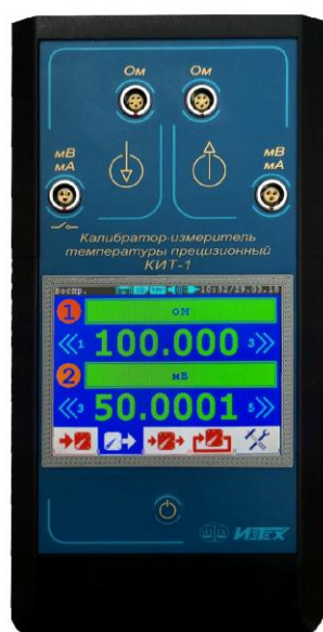
Рисунок 1 – Общий вид калибратора