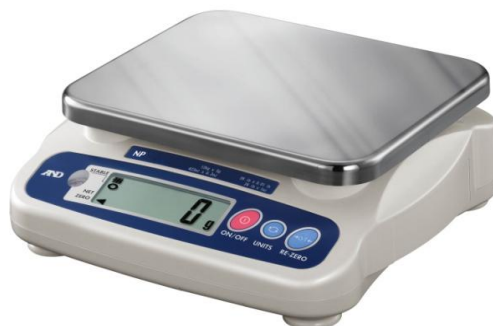
Рисунок 1 – Общий вид весов NP

Общий вид весов NP представлен на рисунке 1.