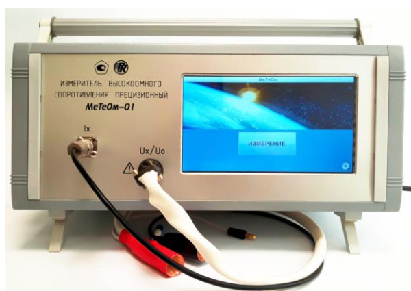
Рисунок 1 – Общий вид измерителя

Схема пломбировки от несанкционированного доступа представлена на рисунке 2.