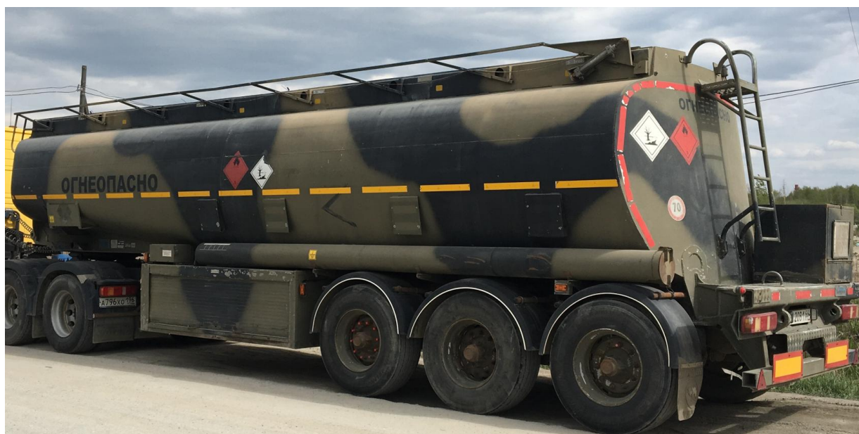
Фото 1. Общий вид полуприцепа-цистерны THOMPSON CARMICHAEL PT44/3