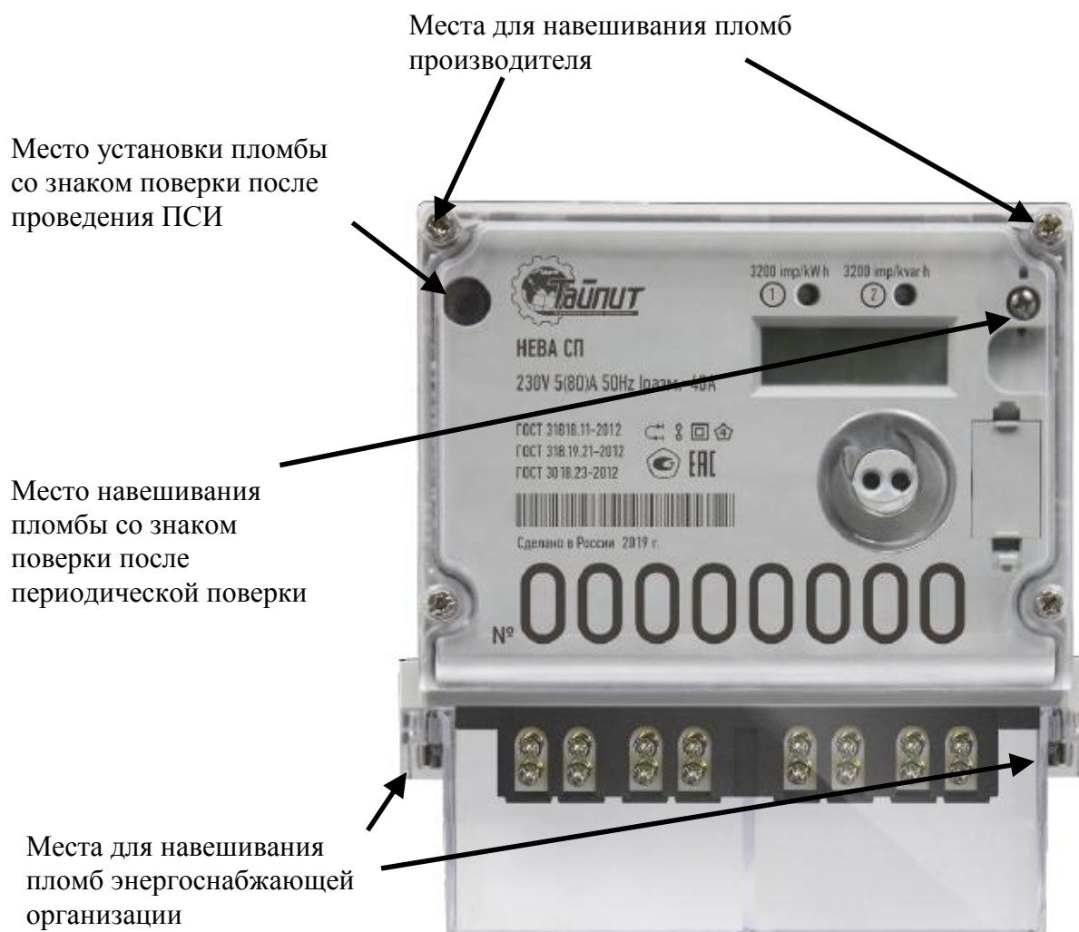
Рисунок 1 - Внешний вид счетчика HEVA SP3 с указанием мест пломбирования