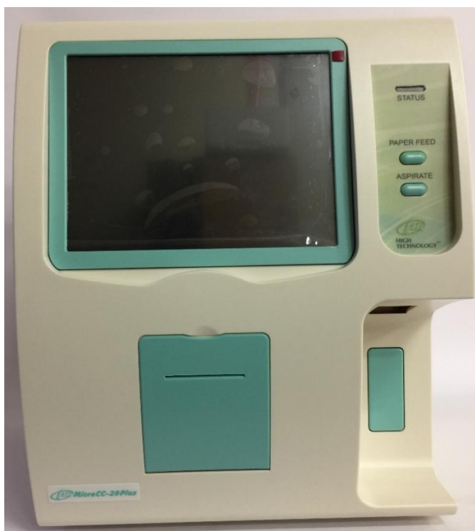
Рисунок 1 – Общий вид анализаторов гематологических MicroCC-20Plus

Схема пломбировки от несанкционированного доступа, обозначение места нанесения знака поверки представлены на рисунке 2.