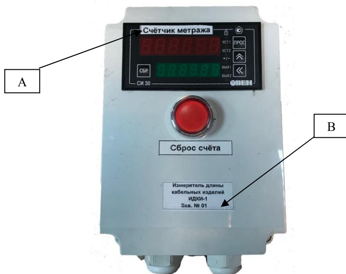
А – месторасположение счётчика импульсов, В – место нанесения знака утверждения типа Рисунок 2 – Общий вид электронного блока

Пломбирование измерителей длины кабельных изделий ИДКИ-1 не предусмотрено.