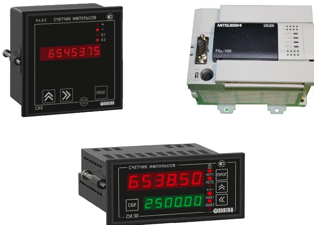
Рисунок 3 – Общий вид счетчиков импульсов

Пломбирование измерителей длины кабельных изделий ИДКИ-1 не предусмотрено.