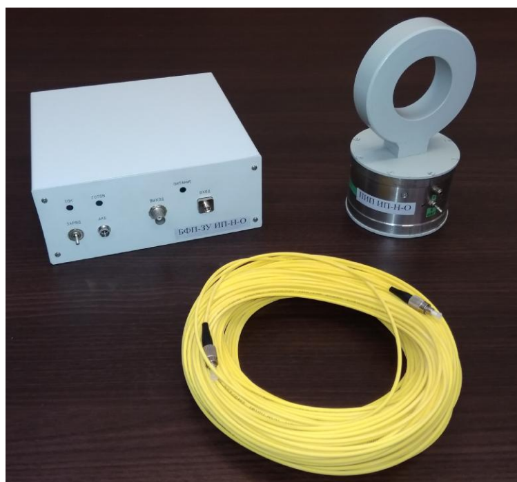
Рисунок 1 – Общий вид преобразователей

Пломбирование модификаций преобразователей не предусмотрено.