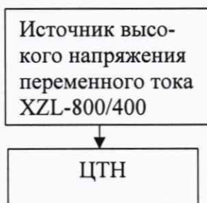
Рисунок 1 – Структурная схема определения электрической прочности изоляции

3) поочередно подключить источник высокого напряжения переменного тока XZL-800/400 между цепями, приведенными в таблице 4, с выдачей испытательного напряжения в течении 1 мин;