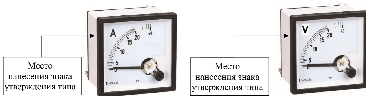
Рисунок 1 - Общий вид амперметров и вольтметров с указанием мест нанесения знака утверждения типа

Пломбирование амперметров и вольтметров не предусмотрено.