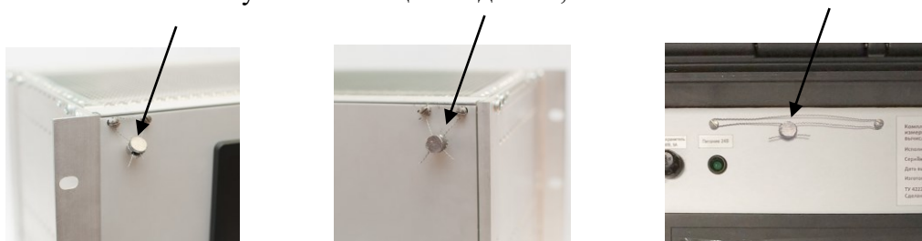
Рисунок 6 – Места нанесения знака поверки, приборное исполнение