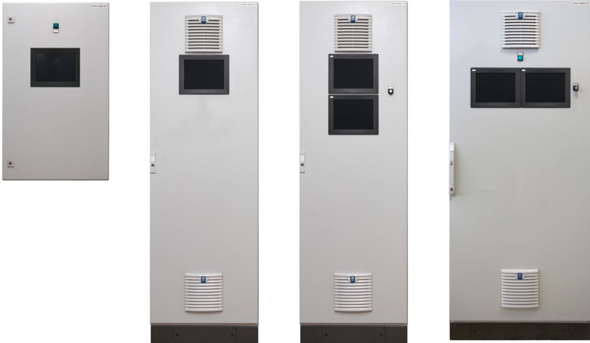
Рисунок 2 – Общий вид ИВК, исполнения 2, 3, 4 и 5