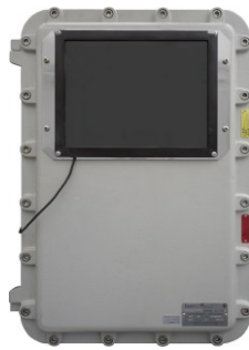
Рисунок 3 – Общий вид ИВК, исполнение 6