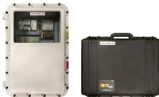
Рисунок 5 – Общий вид ИВК, исполнение 9