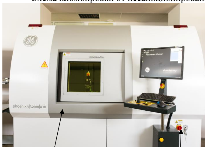
Схема пломбировки от несанкционированного доступа представлена на рисунке 2.