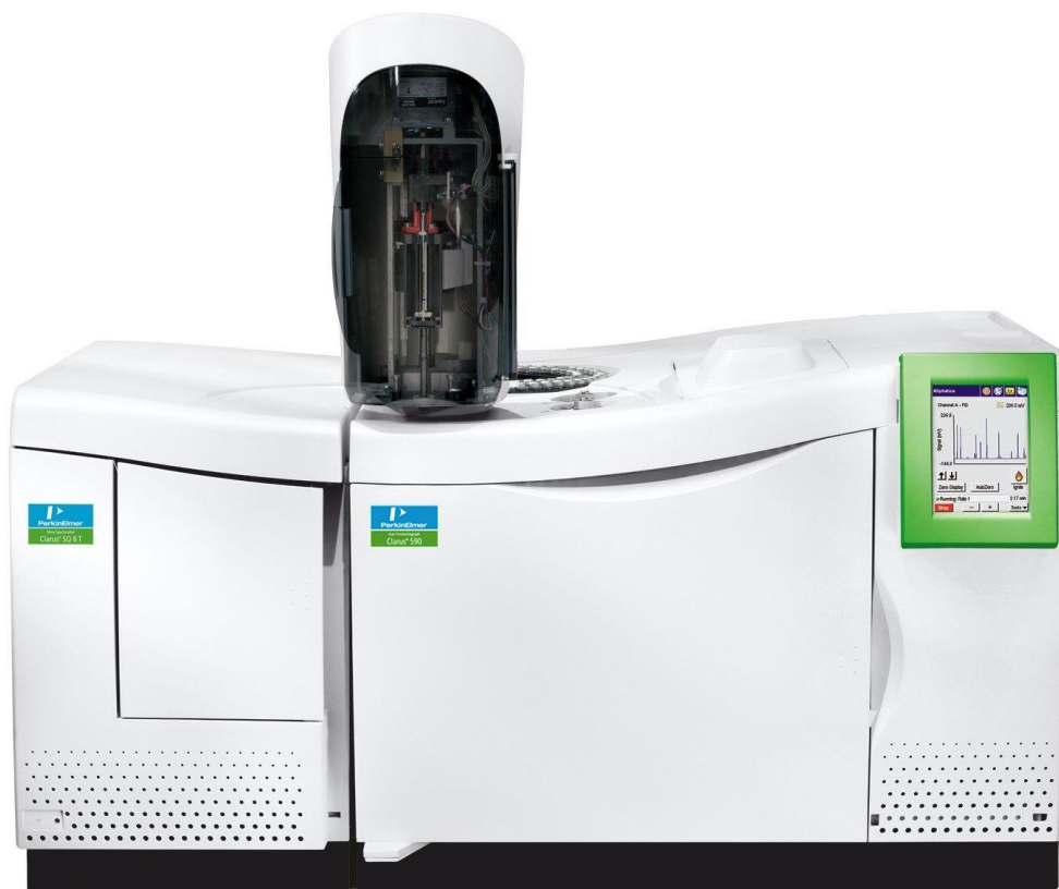
Рисунок 4 - Общий вид хроматографа с детектором МСД