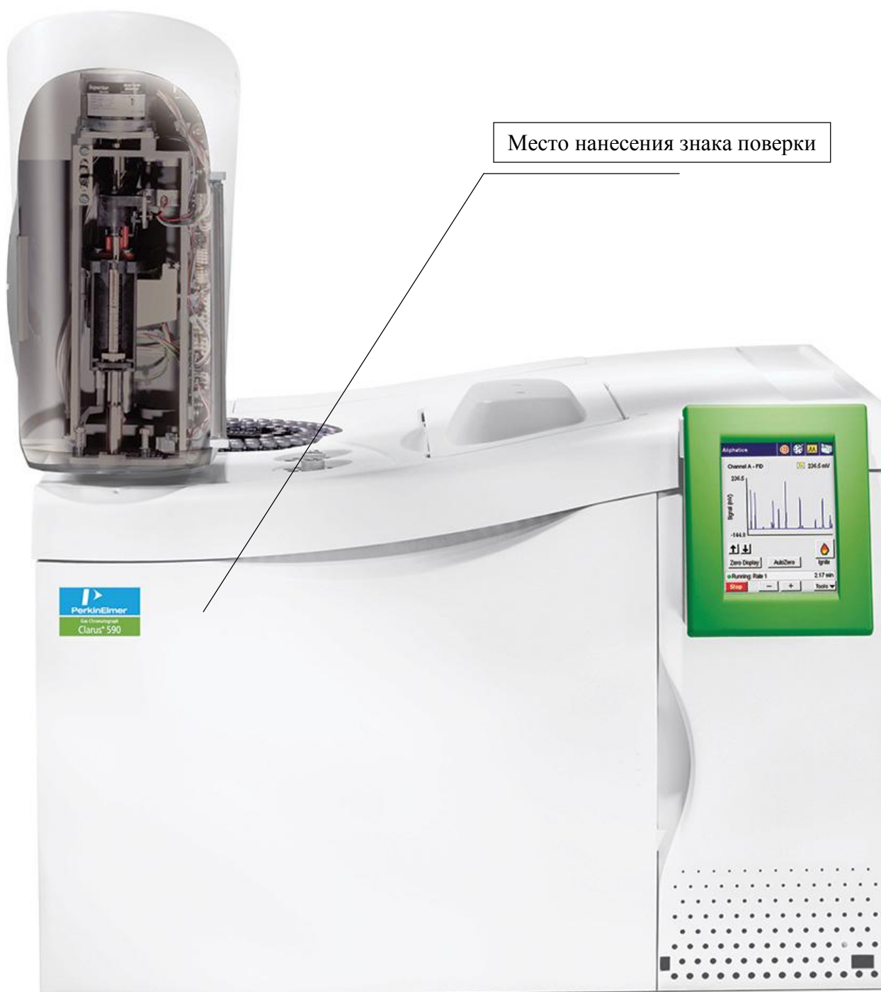
Рисунок 1- Общий вид хроматографов Clarus 590