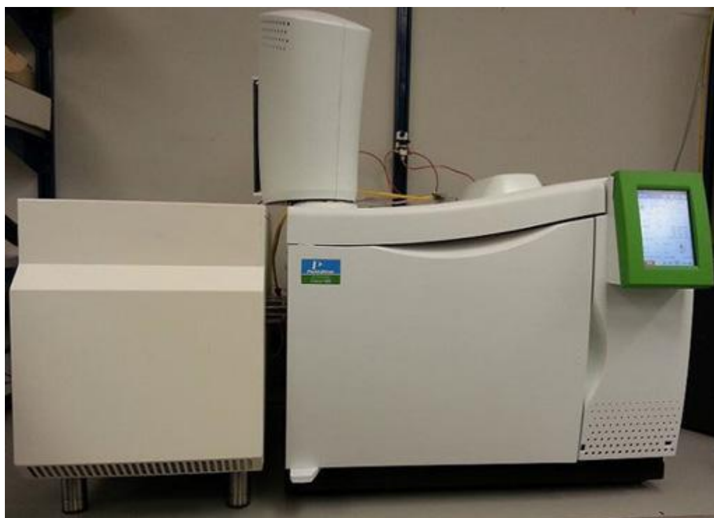
Рисунок 5 - Общий вид хроматографа с детектором ХЛД