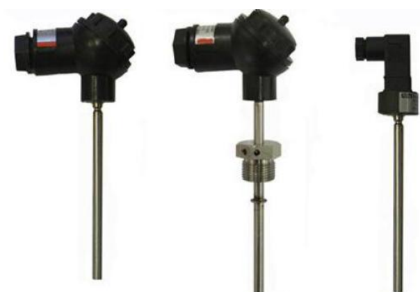
з) комплекты термопреобразователей сопротивления платиновых КТСПТВХ-В