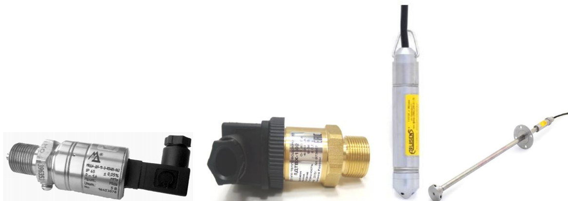
з ) Датчики давления МИДА-15