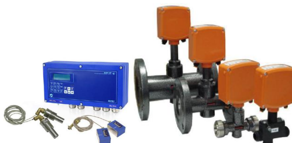
и) преобразователи расхода ВПС