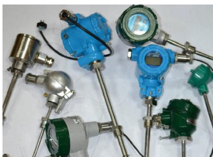
б) термопреобразователи сопротивления ТС-Б