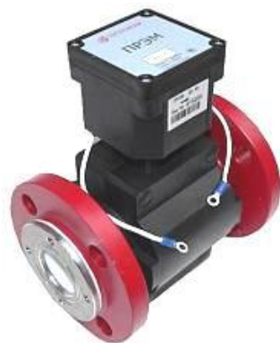
к) преобразователи расхода ПРЭМ