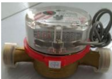
б) счетчики воды СВК