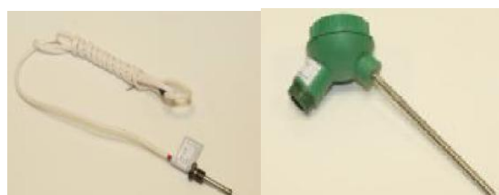
Модификация DS Модификация PL г) термопреобразователи сопротивления платиновые ТЭСМА