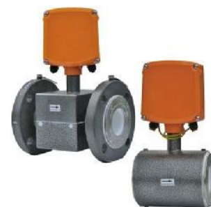
в) преобразователи расхода МастерФлоу