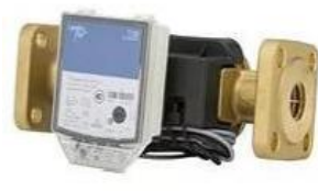
ж) счетчики воды ULTRAHEAT T