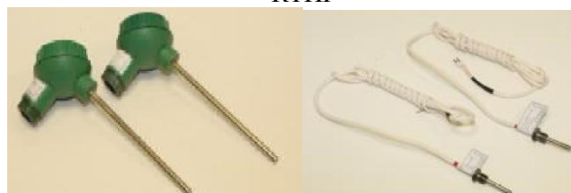
Модификация DS Модификация PL д) комплекты термопреобразователей сопротивления платиновых ТЭСМА-К