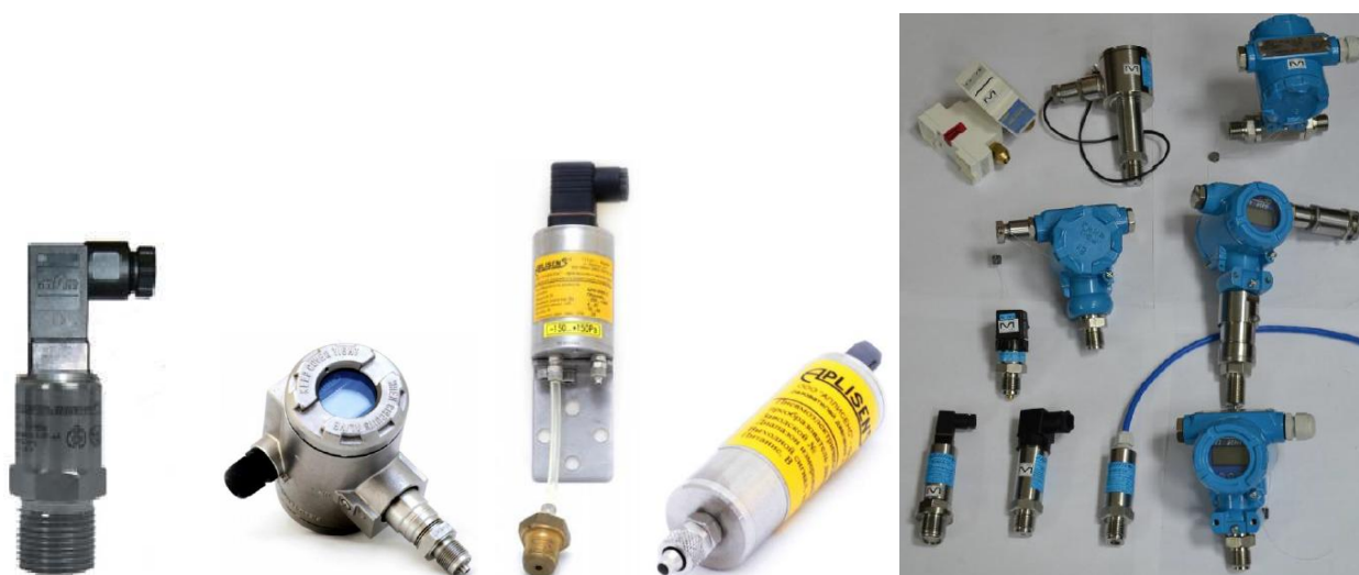
г) преобразователи давления ПД-Р