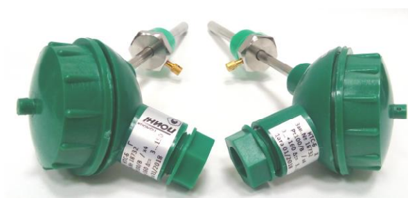
к) комплекты термопреобразователей сопротивления платиновых КТС-Б