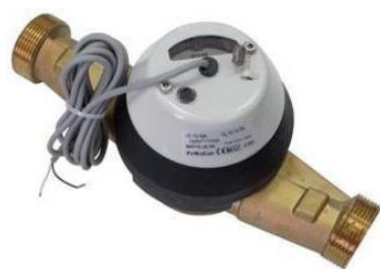
а) счетчики воды ВСХН