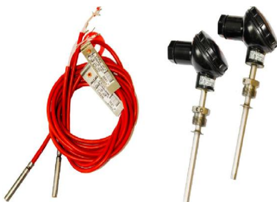
и) комплекты термопреобразователей сопротивления КТСП-Н