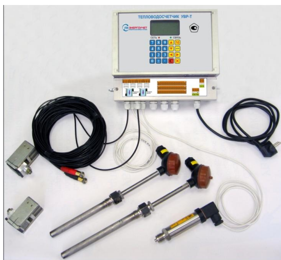
а) модификация М исполнение М1

Первичные преобразователи давления, применяемые в составе тепловосчетчиков приведены в таблице 3 и на рисунке 3.