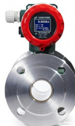
м) расходомеры Питерфлоу РС