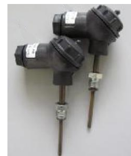
в) комплекты термометров сопротивления из платины технических разностных КТПР