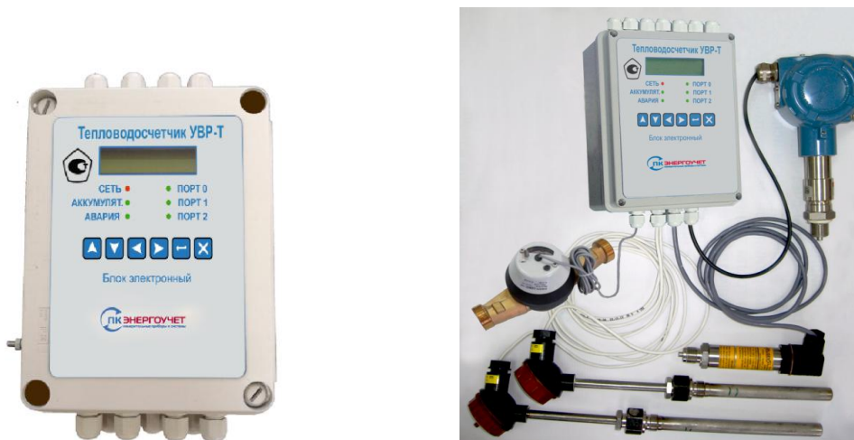
Рисунок 5–Общий вид тепловодосчетчика УВР-Т С

Общий вид тепловодосчетчика УВР-Т С приведен на рисунке 5.