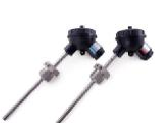
ж) термопреобразователи сопротивления платиновые ТСПТВХ