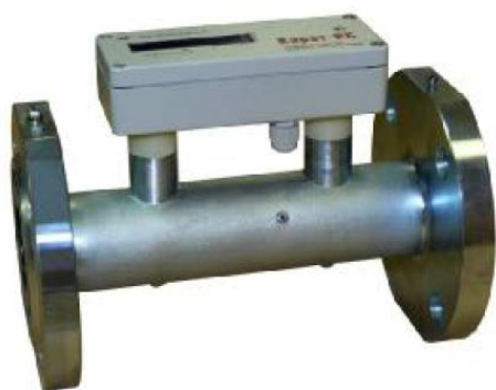
г) расходомеры-счетчики жидкости ультразвуковые КАРАТ