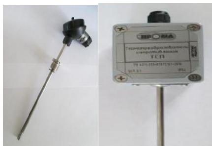
а) термопреобразователи сопротивления платиновый ТСП, ТСП-К