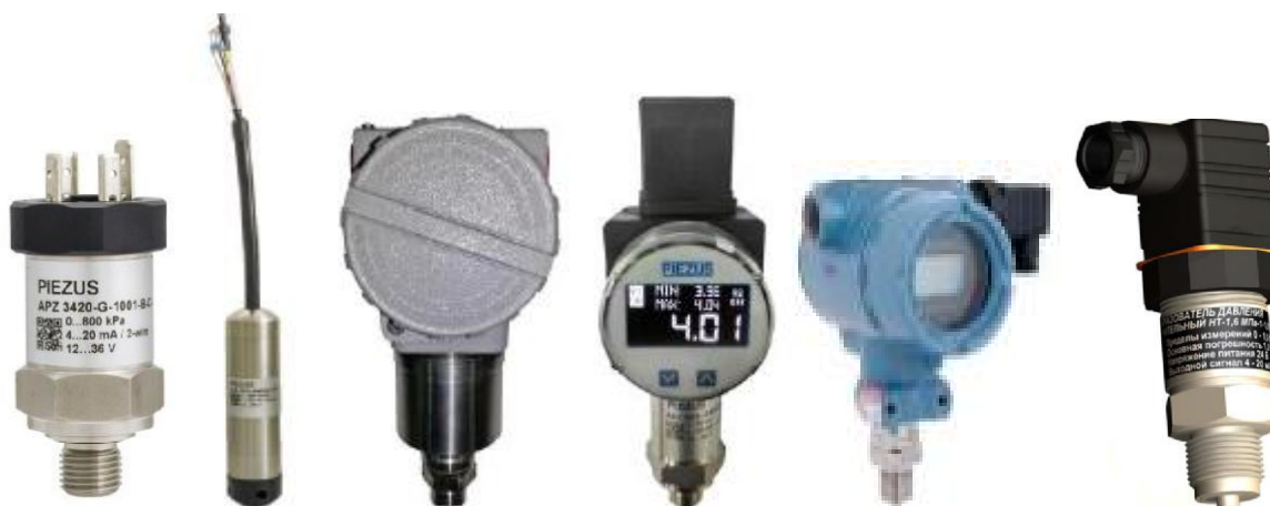
а) датчики давления тензорезистивные APZ, ALZ, AMZ, ASZ