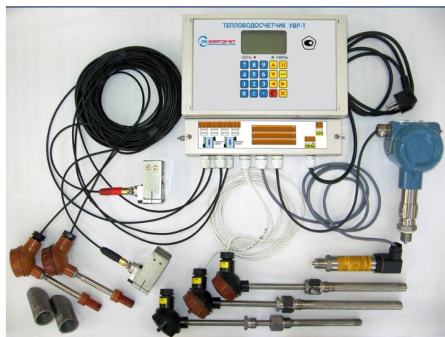
б) модификация М исполнение М2