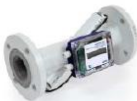
з) расходомеры-счетчики ВЗЛЕТ МР