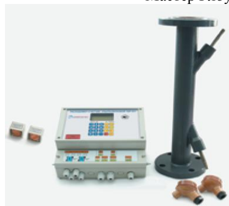
д) расходомеры-счетчики ультразвуковые УВР-011