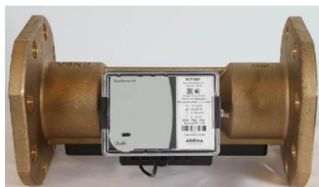
л) преобразователи расхода SonoSensor 30