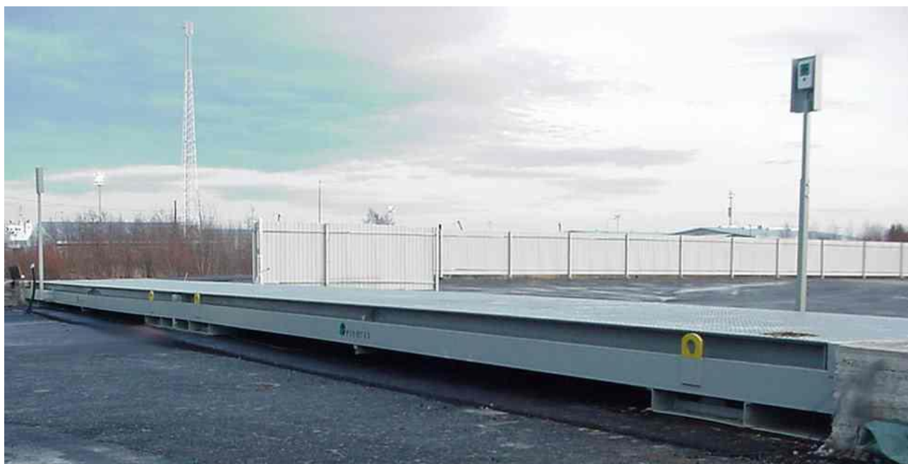
Рисунок 1 – Общий вид весов Scalex 1000/Scalex 1000P (ГПУ – металлические)

Общий вид весов представлен на рисунках 1 и 2, а индикаторов со схемами пломбировки от несанкционированного доступа и обозначениями мест нанесения знака поверки представлены на рисунках 3 и 4.