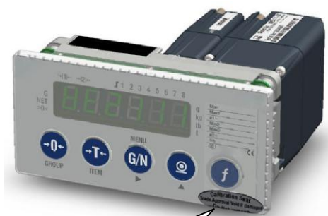
Места нанесения знака поверки