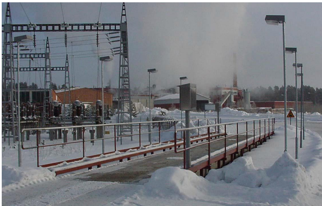
Рисунок 2 – Общий вид весов Scalex 1001 (ГПУ из железобетона)