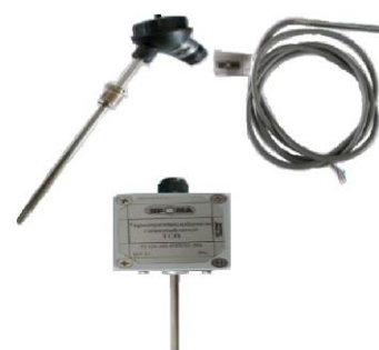
ТСП и ТСП-К