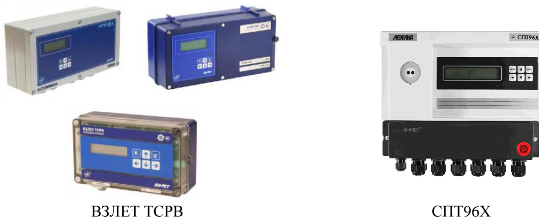
Рисунок 1 – Общий вид и наименование типа тепловычислителей, входящих в состав теплосчетчиков-регистраторов ВЗЛЕТ ТСР-М

Пломбировка от несанкционированного доступа теплосчетчиков-регистраторов ВЗЛЕТ ТСР-М осуществляется в соответствии с требованиями, указанными в описаниях типа средств измерений, входящих в состав теплосчетчиков-регистраторов ВЗЛЕТ ТСР-М.