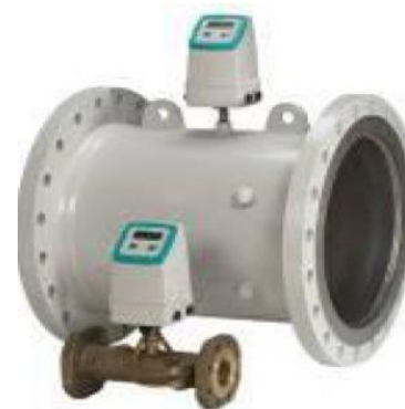
Sitrans F US