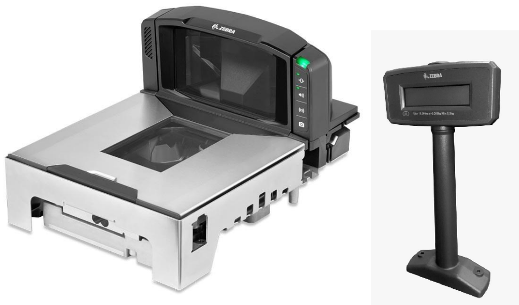
Рисунок 1 — Общий вид средства измерений (ГПУ стандартной длины, электронное устройство, встроенный сканер штрих кодов и клавиши управления в едином корпусе — слева, показывающее устройство в исполнении с одним дисплеем — справа)

Защита от несанкционированного доступа осуществляется с помощью электронной пломбы (раздел программное обеспечение).