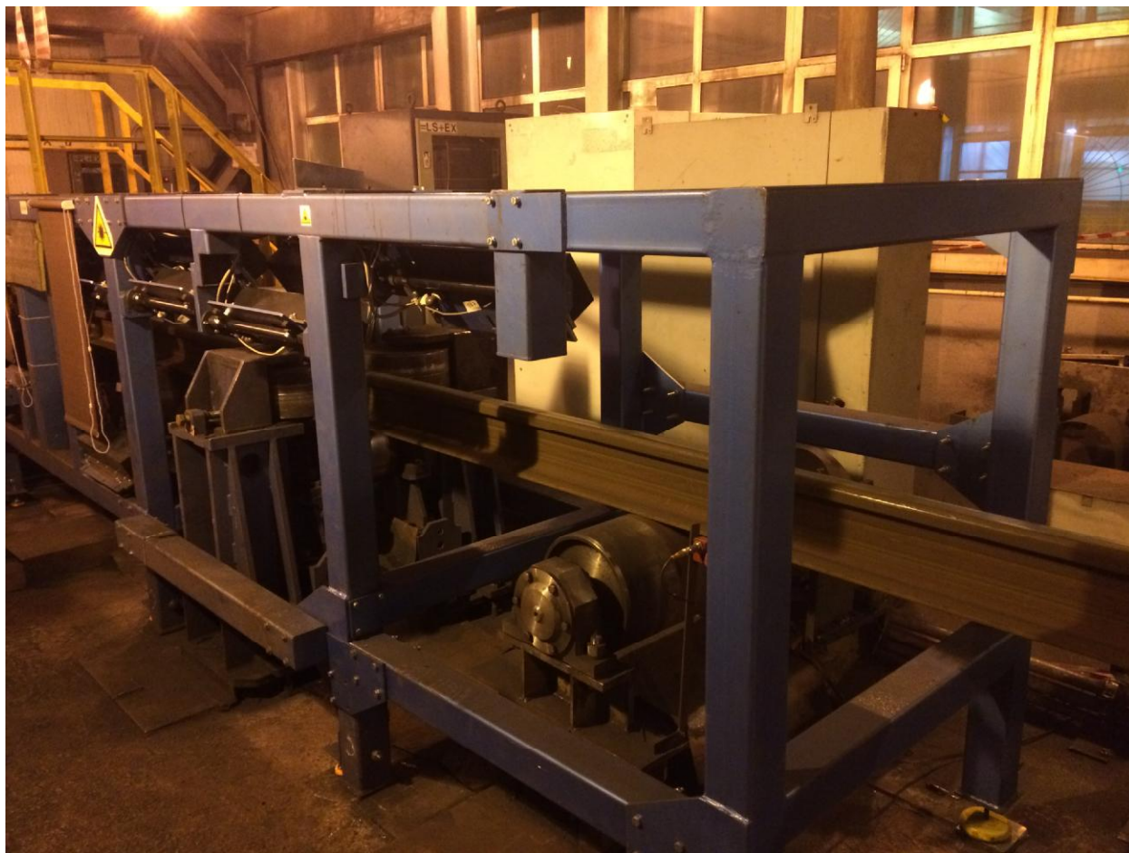
Рисунок 2 – Общий вид системы автоматизированного измерения профиля железнодорожных рельсов ИПР НК