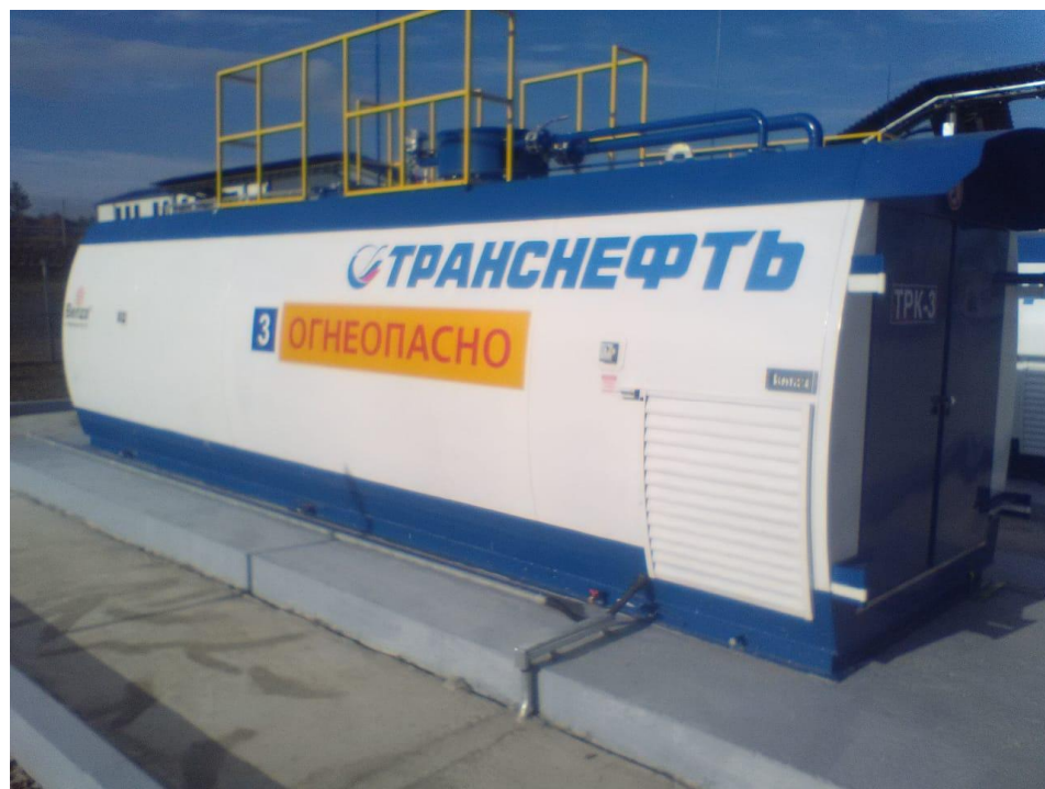
Рисунок 4 - Общий вид резервуаров РГСД-20 №№ 1003, 1007, 1008