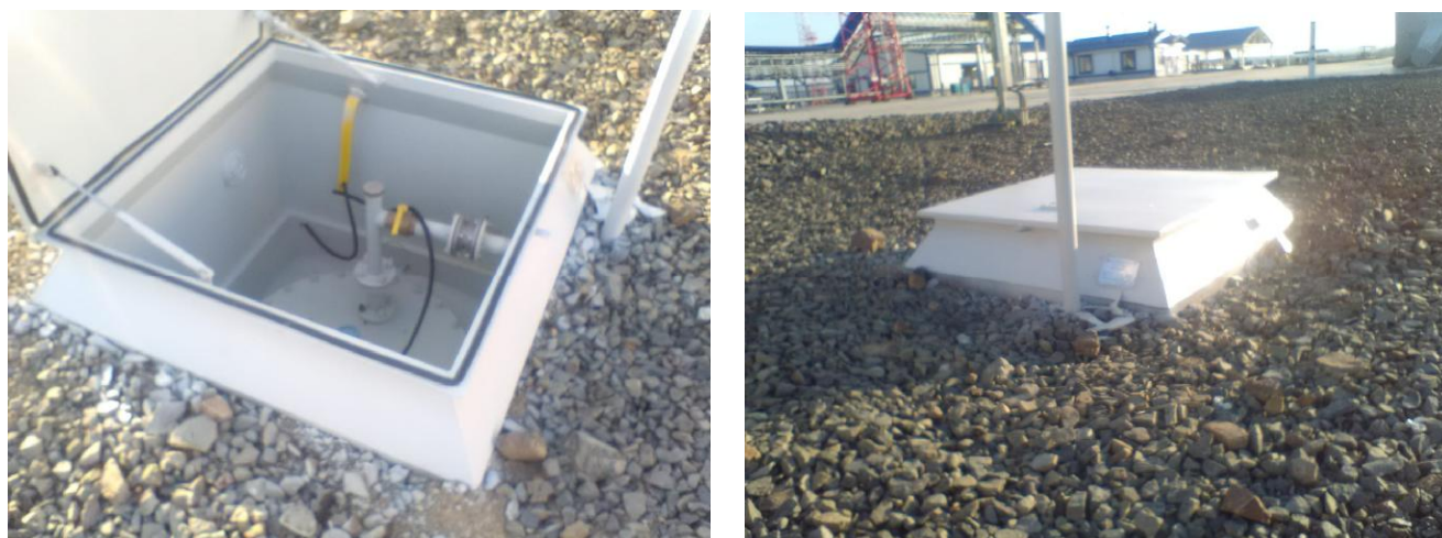
Рисунок 3 - Общий вид видимой части конструкции резервуара РГС-25 № 1001