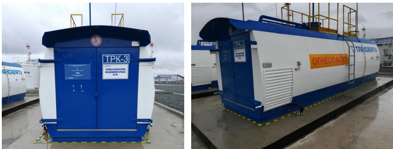
Рисунок 1 - Общий вид резервуаров РГСД-20 №№ 966, 967, 968