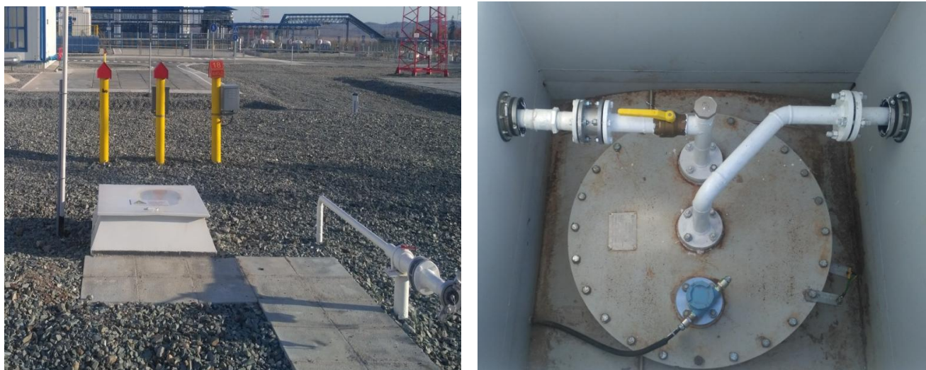
Рисунок 2 - Общий вид видимой части конструкции резервуара РГС-25 № 971