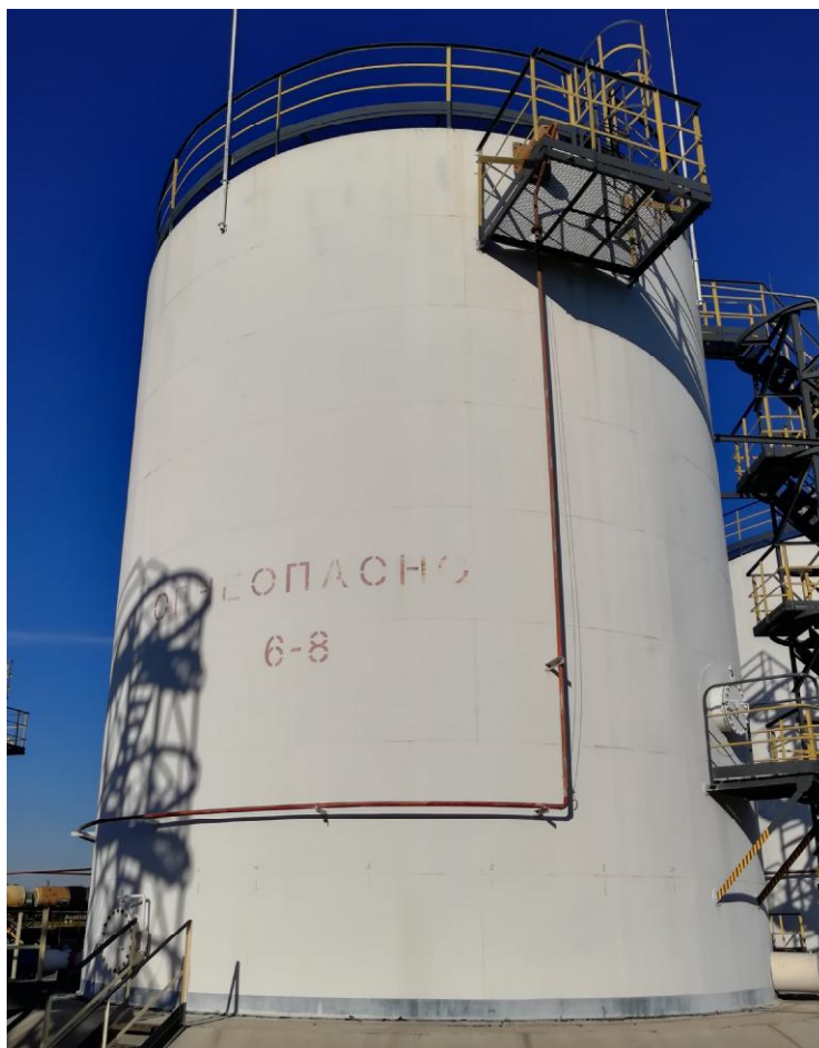
Рисунок 2 - Общий вид резервуара стального вертикального цилиндрического РВСП-1000