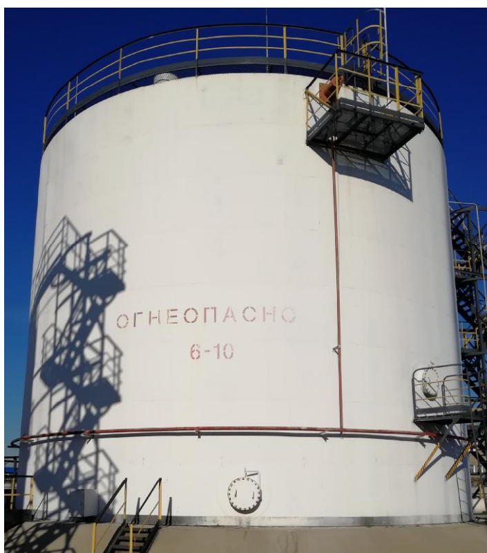
Рисунок 3 - Общий вид резервуара стального вертикального цилиндрического РВСП-2000