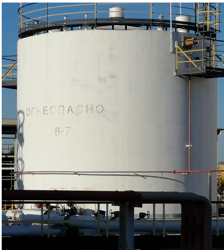
Рисунок 1 - Общий вид резервуара стального вертикального цилиндрического РВСП-700

Пломбирование резервуаров стальных вертикальных цилиндрических РВСП-700, РВСП-1000, РВСП-2000, РВС-2000, РВСП-3000 не предусмотрено.