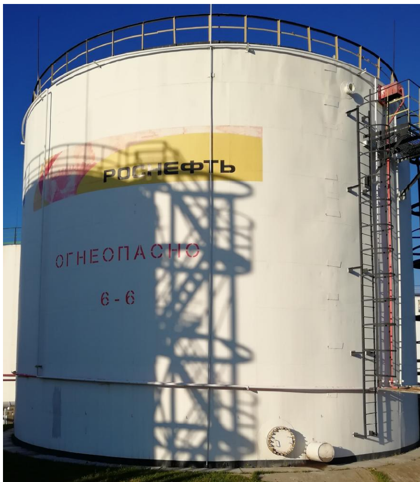
Рисунок 4 - Общий вид резервуара стального вертикального цилиндрического РВС-2000