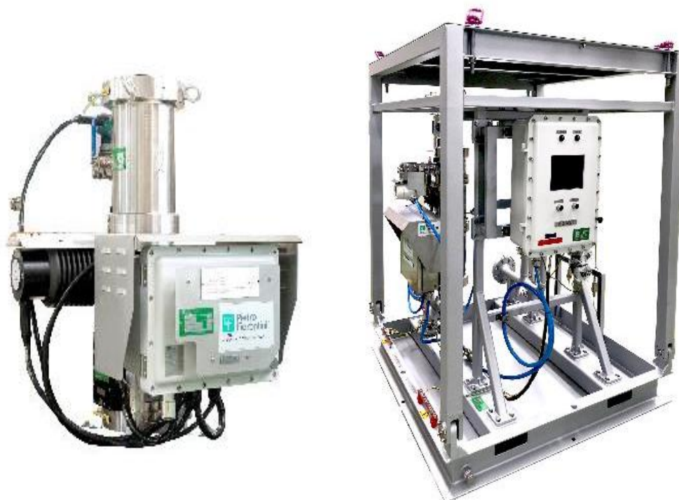
Рисунок 1 - Общий вид расходомера, и расходомера, смонтированного вместе с компьютером потока на единой раме

Расходомеры могут поставляться в подогреваемом теплоизолированном блок-боксе или в комплекте с солнцезащитным навесом. Фотографии общего вида расходомеров приведены на рисунке 1, места пломбирования показаны на рисунке 2.