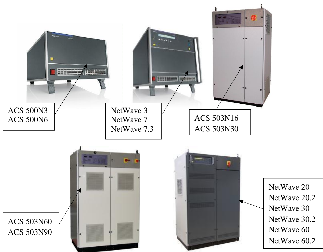
Рисунок 2 – Общий вид ИП