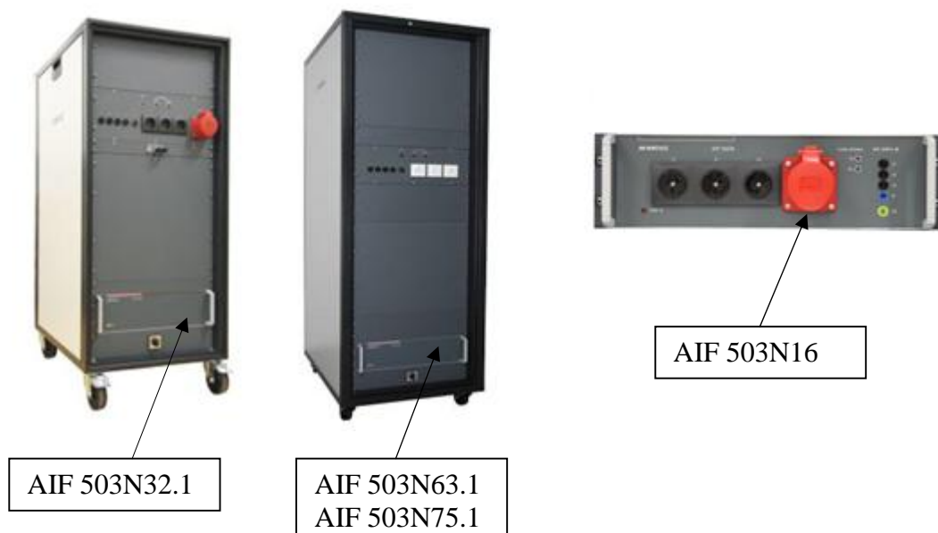
Рисунок 3 – Общий вид ПС