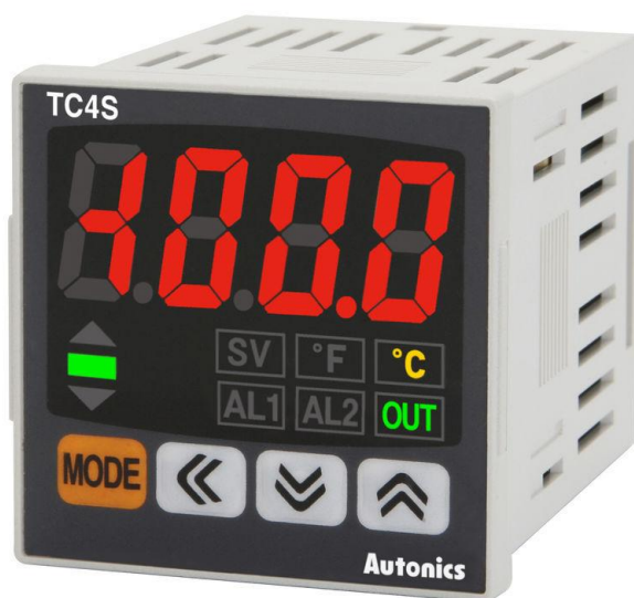
Рисунок 1 – Общий вид приборов серии TC4

Фотографии общего вида приборов приведены на рисунках 1-2.