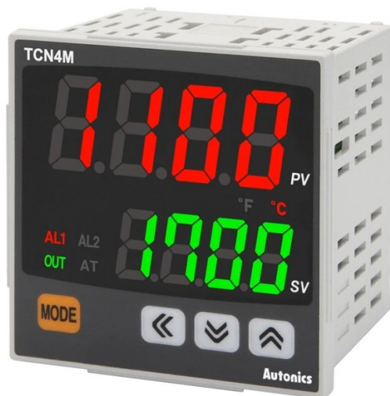
Рисунок 2 – Общий вид приборов серии TCN4