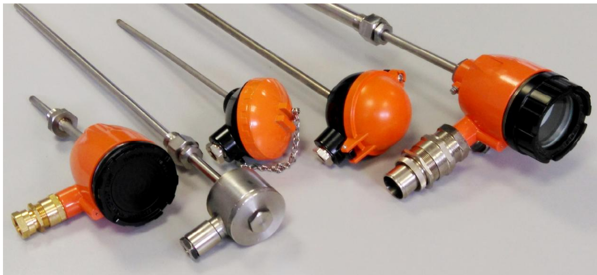
Рисунок 1 - Датчики температуры серий ТП, ТР

Общий вид датчиков температуры серий ТП, ТР представлен на рисунке 1.