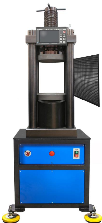
Рисунок 1 – Общий вид машин испытательных ПГМ1000-МГ4, ПГМ1500-МГ4 и ПГМ500.А-МГ4