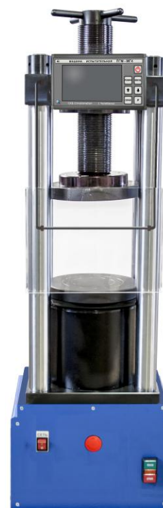
Рисунок 3 – Общий вид машины испытательной ПГМ250.А-МГ4