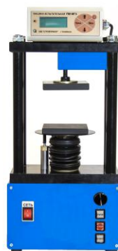
Рисунок 5 – Общий вид машин испытательных ПМЭ-МГ4