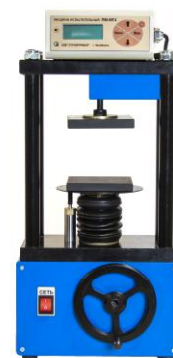
Рисунок 6 – Общий вид машин испытательных ПМР-МГ4