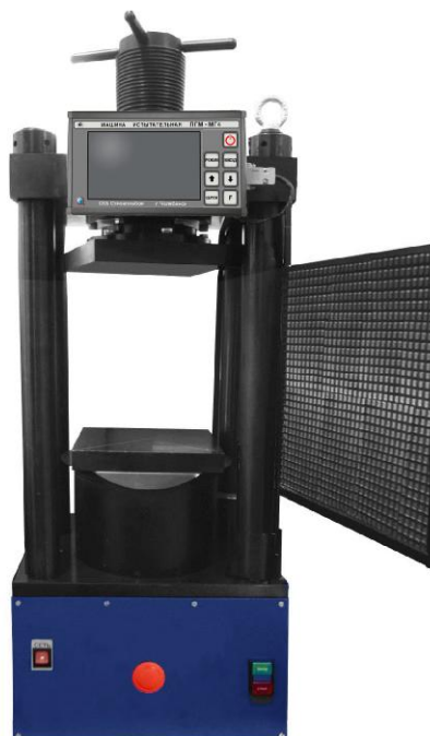
Рисунок 2 – Общий вид машин испытательных ПГМ250-МГ4 и ПГМ500-МГ4