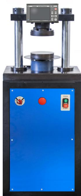
Рисунок 4 – Общий вид машин испытательных ПМЭ-50МГ4 и ПМЭ-100МГ4