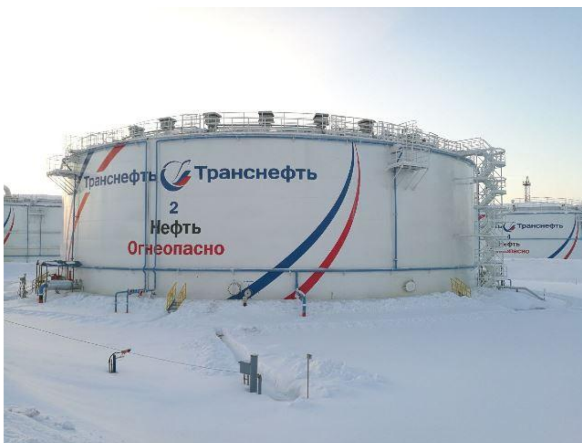
Рисунок 1 - Общий вид резервуара вертикального стального цилиндрического РВС-20000