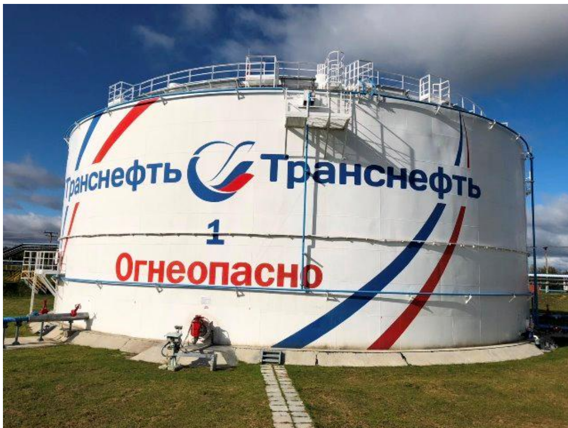
Рисунок 2 - Общий вид резервуара вертикального стального цилиндрического РВСП-10000