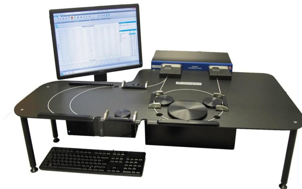
Рисунок 1 – Общий вид системы

Схема пломбировки от несанкционированного доступа, обозначение места нанесения знака поверки представлены на рисунке 2.