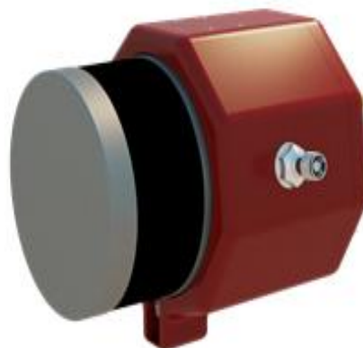
Рисунок 2 – Общий вид сканера со стороны боковой панели

На передней панели сканера расположен лазерный дальнометрический сканер.