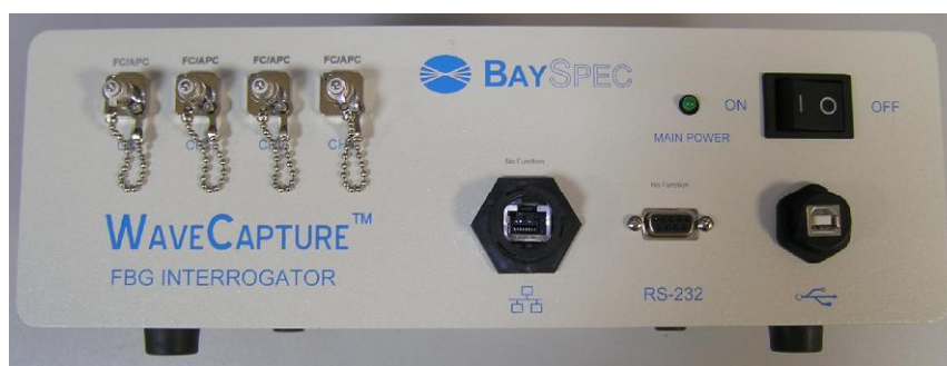
Рисунок 1 – Общий вид АСВОД

Схема пломбировки от несанкционированного доступа, обозначение места нанесения знака поверки и маркировка представлены на рисунке 2.