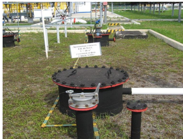
Рисунок 3 - Общий вид места установки резервуаров РГС-40 № 1, 9