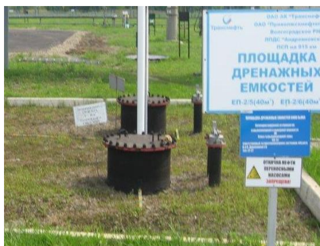
Рисунок 4 - Общий вид места установки резервуаров РГС-40 № 4, 10