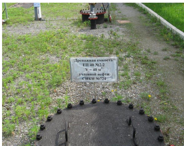
Рисунок 2 - Общий вид места установки резервуаров РГС-40 № 7, 8