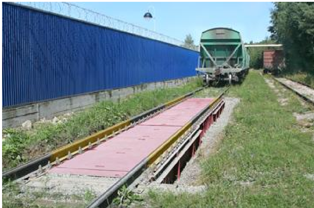
Схема пломбировки от несанкционированного доступа и обозначение мест нанесения знака поверки представлены на рисунке 4.

Общий вид весов представлен на рисунках 1 и 2, общий вид приборов весоизмерительных Т (индикаторов) представлен на рисунке 3.