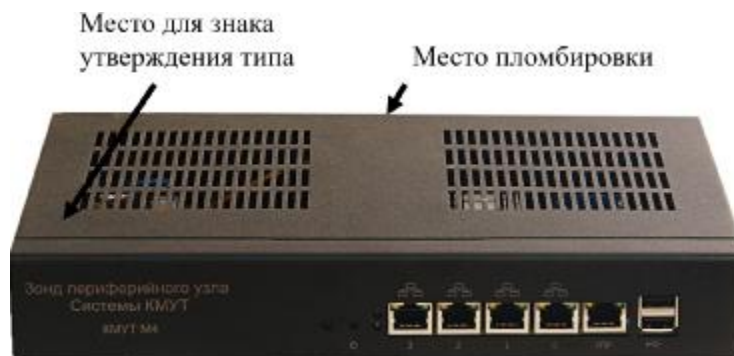
Рисунок 1 – Общий вид модификации зондов КМУТ – КМУТ М4

Общий вид модификаций зондов КМУТ представлен на рисунках 1 и 2.