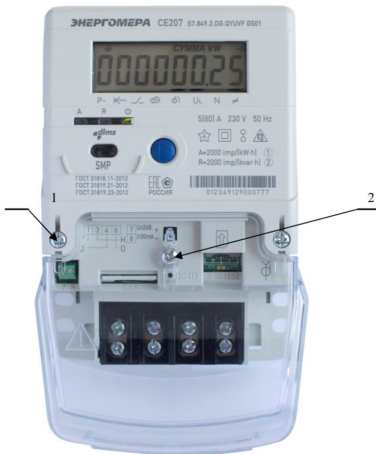
Рисунок 2 – Общий вид счетчика CE207 S7