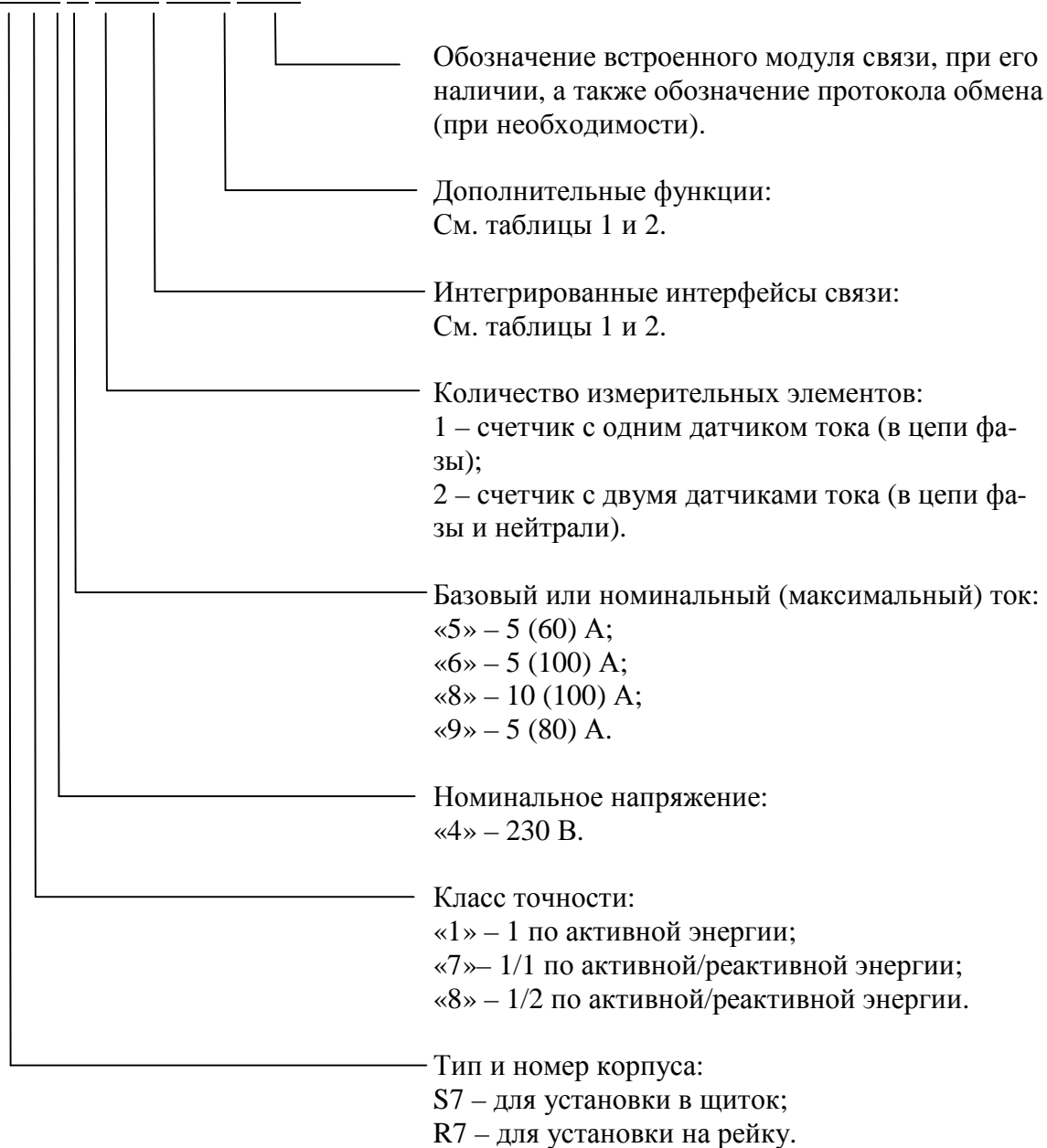
Рисунок 1 - Структура условного обозначения счетчиков