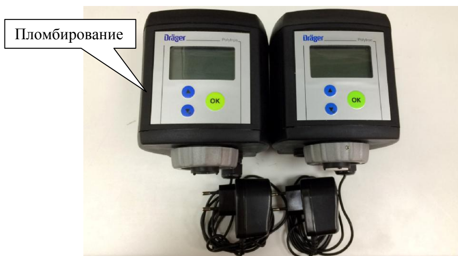
Рисунок 2 – Общий вид датчиков контроля стабильности Dräger Polytron 7000 (с сенсорами Hydrazin и NO 2 )