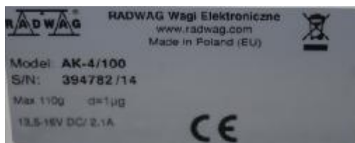
Рисунок 3 – Маркировка компаратора массы