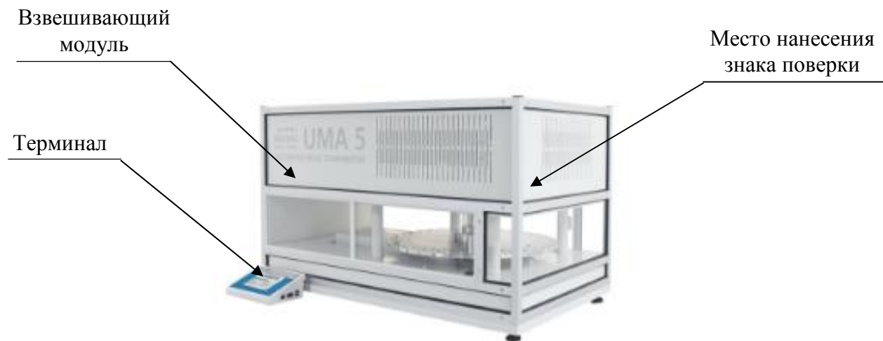
Рисунок 1 – Общий вид компаратора массы автоматического UMA и обозначение места нанесения знака поверки

- регистрация, архивация результатов измерений. Компараторы снабжены защищенными интерфейсами USB, RS 232, Ethernet, Inputs/Outputs (digital), Wireless Connection. Общий вид компараторов представлен на рисунках 1, 2 и 3.