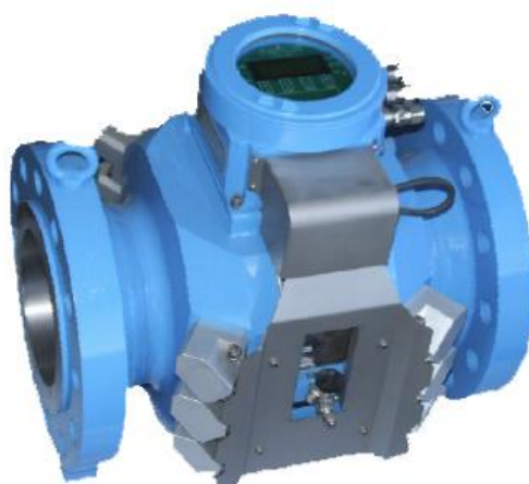
Рисунок 1 – Общий вид счетчика