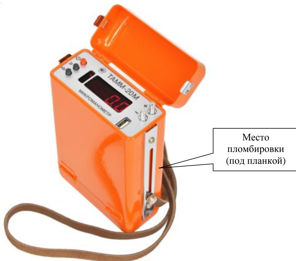
Рисунок 1 – Общий вид измерителя со стороны микроманометра