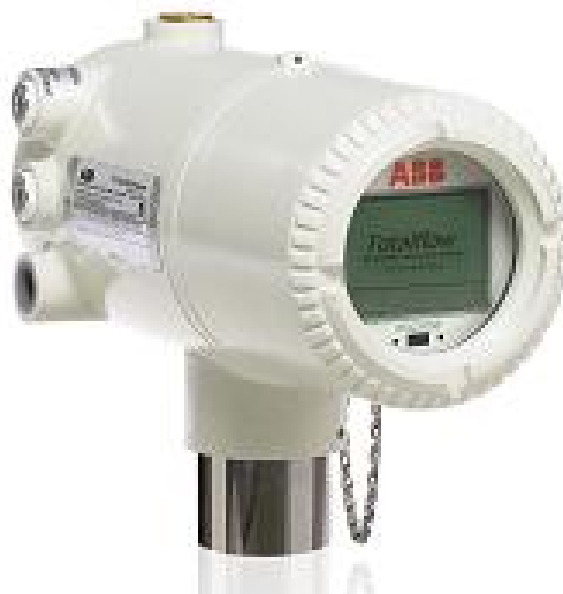
Рисунок 1 – Общий вид хроматографа PGC1000