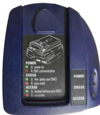
Рисунок 2 – Считыватель LDM 320