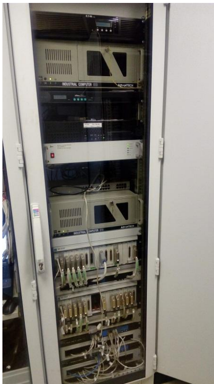
Рисунок 1 – Общий вид системы

Комплекс измерительно-вычислительный MIC-036R