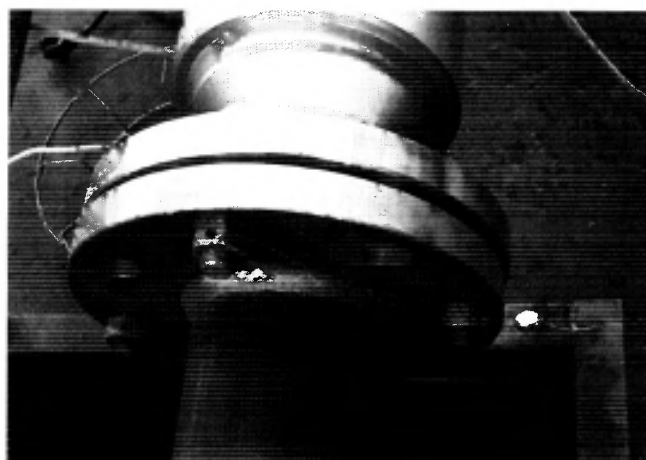
Рисунок А.2 – Пломба поверителя препятствующая демонтажу СРМ с участка измерительного трубопровода