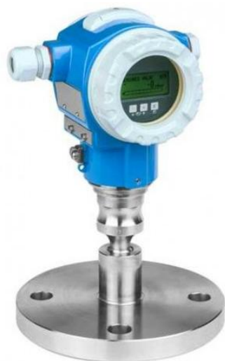
Рисунок 5 - Общий вид преобразователей давления измерительных Cerabar S PMP75