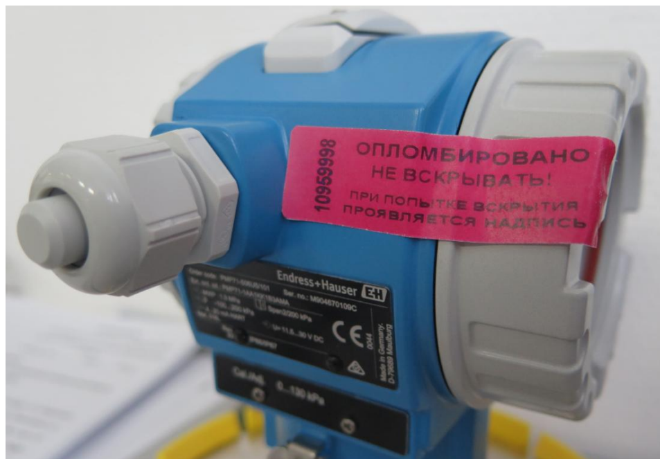
Рисунок 7 - Схема пломбирования корпуса преобразователя