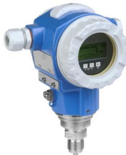
Рисунок 4 - Общий вид преобразователей давления измерительных Cerabar S PMP71