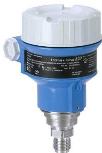
Рисунок 1 - Общий вид преобразователей давления измерительных Cerabar M PMP51