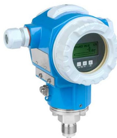
Рисунок 6 - Общий вид преобразователей давления измерительных Cerabar S PMC71