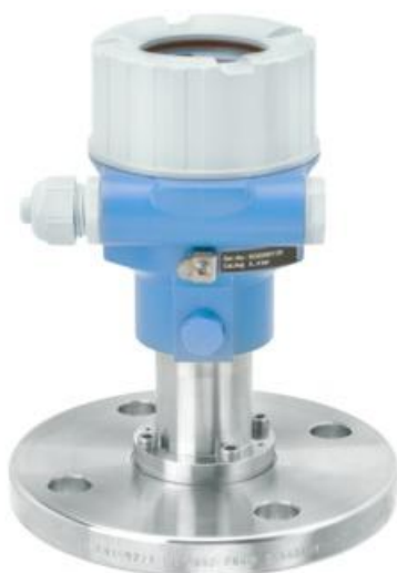
Рисунок 3 - Общий вид преобразователей давления измерительных Cerabar M PMC51