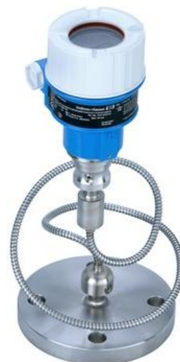
Рисунок 2 - Общий вид преобразователей давления измерительных Cerabar M PMP55