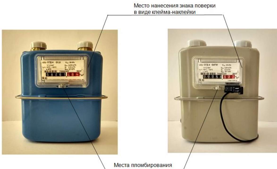
Рисунок 2 – Схема опломбирования счетчика, обозначение мест нанесения знака поверки