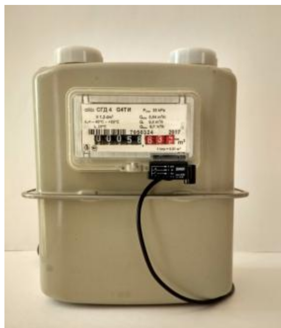
б) Общий вид счетчиков газа СГД 4-х-х-XI, СГД 4-х-х-XTI