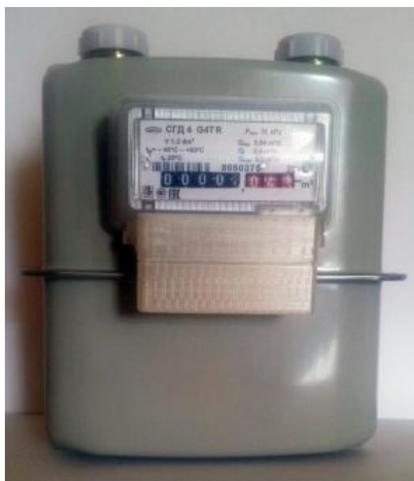
в) Общий вид счетчиков газа СГД 4-х-х-XR, СГД 4-х-х-XTR