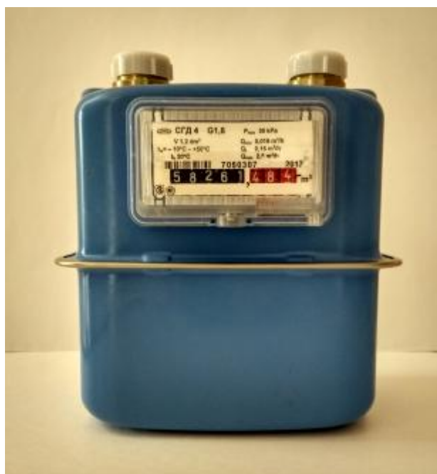
а) Общий вид счетчиков газа СГД 4-х-х-X, СГД 4-х-х-XT

Общий вид счетчиков представлен на рисунке 1.